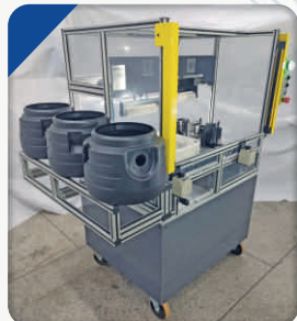
Dispositivo para Corte e Furação do Corpo do Aspirador