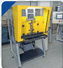
Equipamento semi-automático para Fabricação de Reforços