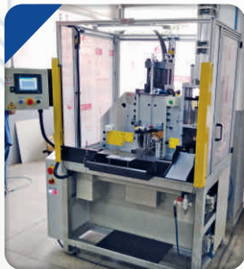
Prensa Dupla para montagem do distanciador