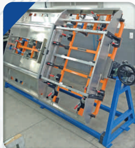
Dispositivo para Soldagem