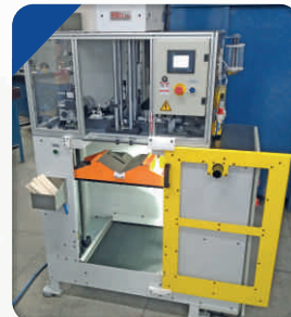
Dispositivo para Teste de Impacto em tubos de PVC