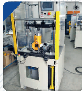
Prensa para inserção de Componentes em Motores Elétricos