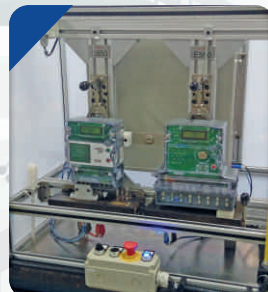
Dispositivo para Teste Elétrico em Medidores de Energia