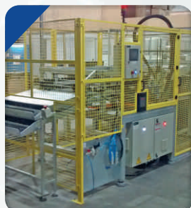
Automação para união de Aruela e Tirante por conformação a frio