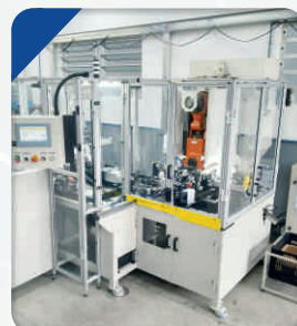
Automação para Fabricação de Terminais Elétricos