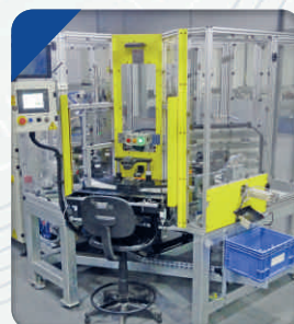
Automação para Fabricação de Reforços Metálicos