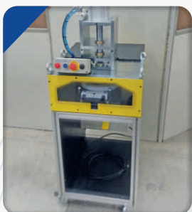
Prensa para prensagem de eixo da máquina de lavar