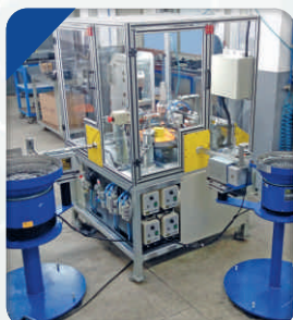
Automação para União entre Porca e Aruela