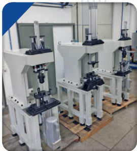
Conjunto de Prensas para Montagem de selo Mecânico, Rolamento e Rotor