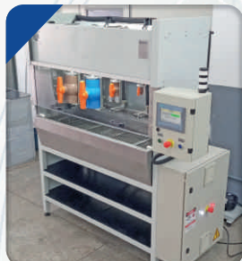
Dispositivo para Teste de Registros e Torneiras