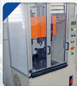
Prensas para inserção de Buchas | Automotivo