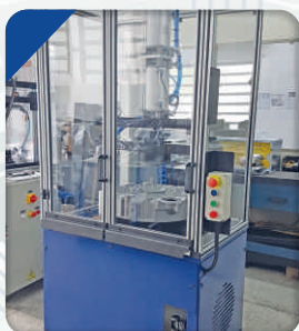
Prensa Pneumática para inserção de Componentes