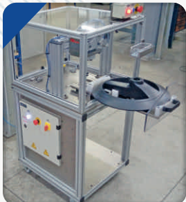
Dispositivo para inserção de Porcas na base do Ventilador