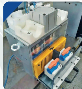
Dispositivo para montagem do volante no Registro de Esferas