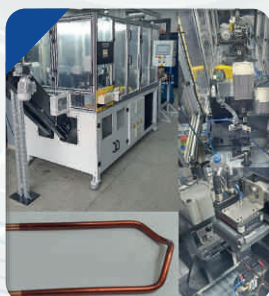
Automação para fabricação de Condutor Elétrico para Motor de Partida