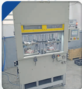
Dispositivo para Teste de Estanqueidade