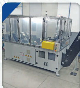
Automação para fabricação de Condutor de cobre chato