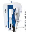
Dobradora serie EBA