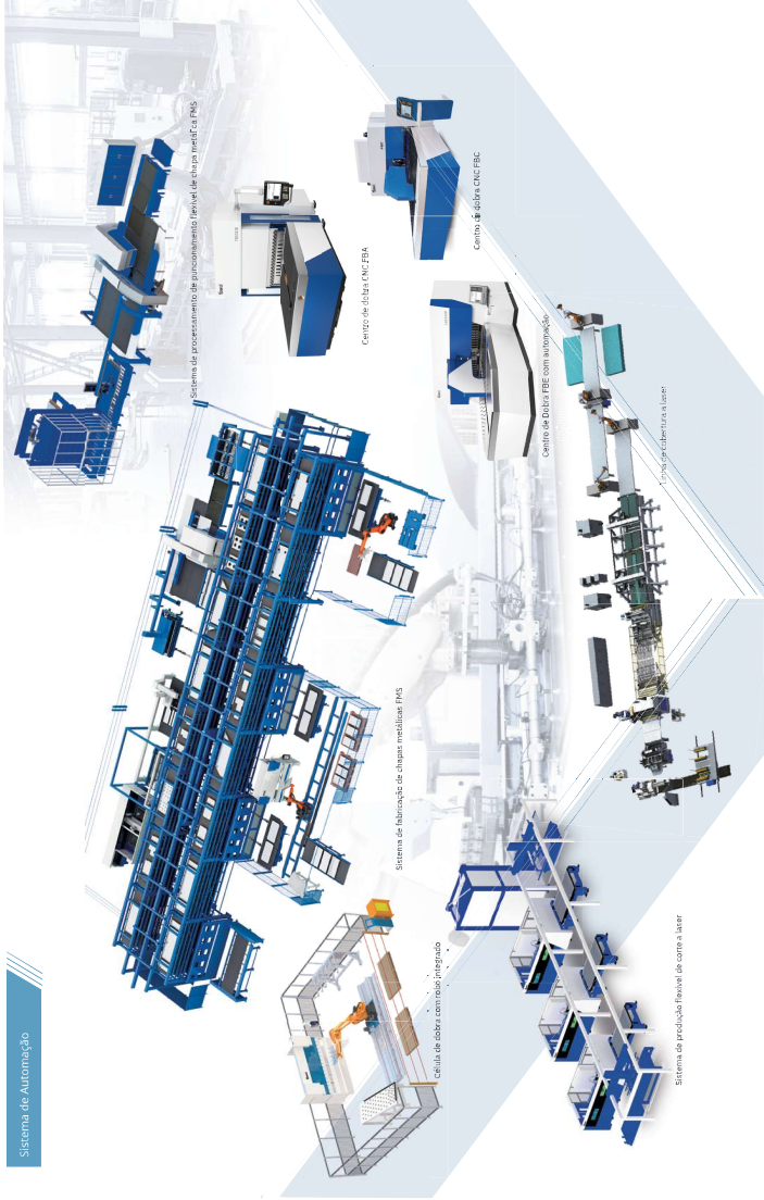
Sistema de procesamiento de almacenamiento (nivel de tiras metálicas)