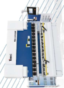
Dobradora serie EBA