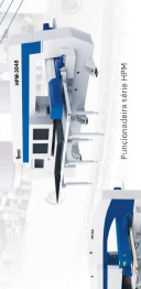
Dobradora serie EBA