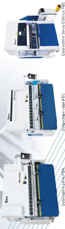
Dobradora serie EBA