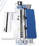
Dobradora serie EBA