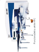
Dobradora serie EBA