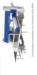
Dobradora serie EBA